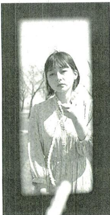
「ノット/KNOTT」の一場面。